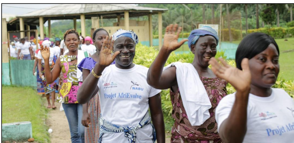
AfriEvolue Atelier apicole dans le parc national d'Azagny avec des groupes de femmes