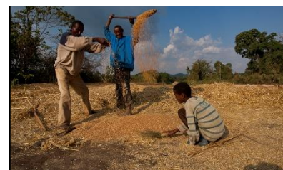
Paysans éthiopiens près de la forêt de Boginda-Yeba